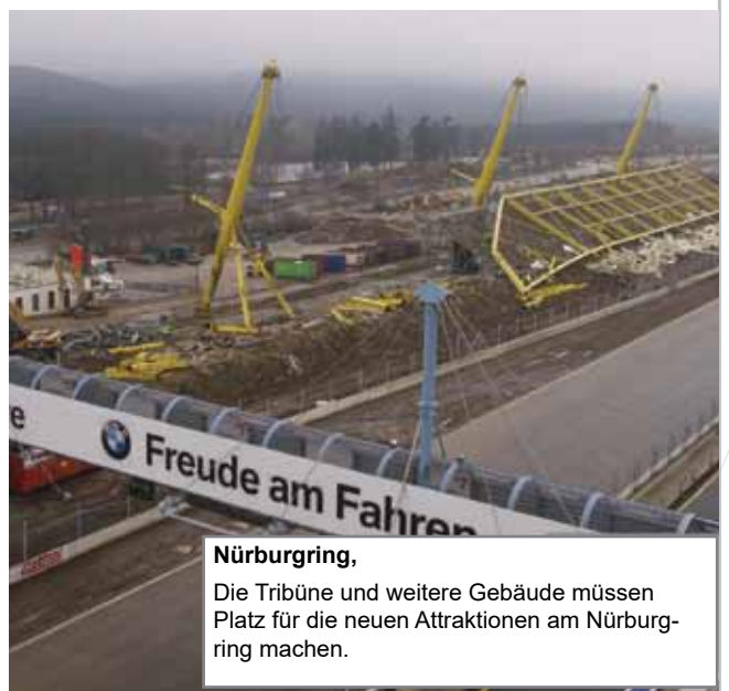
Nürburgring, Die Tribüne und weitere Gebäude müssen Platz für die neuen Attraktionen am Nürburgring machen.