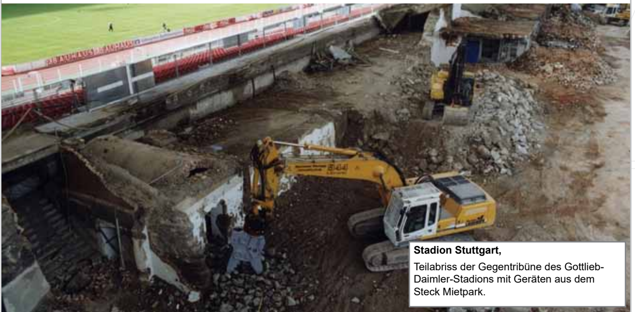
Stadion Stuttgart, Teilabriss der Gegentribüne des Gottlieb-Daimler-Stadions mit Geräten aus dem Steck Mietpark.