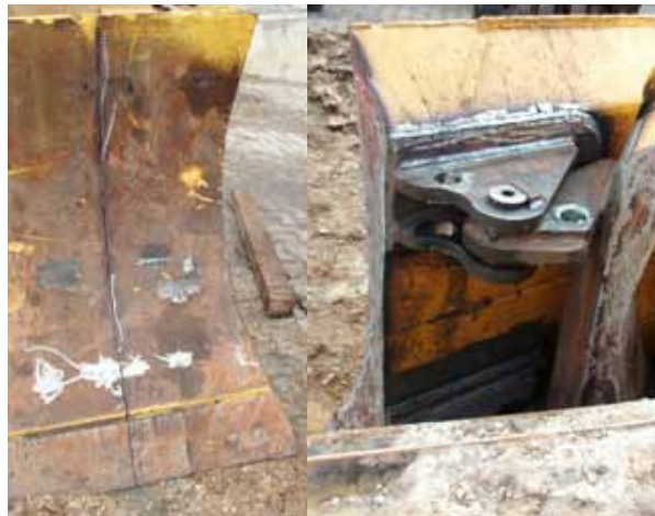
Planierschildumbau auf Klappschild