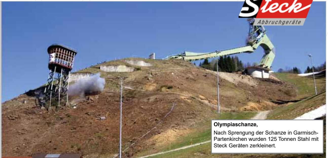
Olympiaschanze, Nach Sprengung der Schanze in Garmisch-Partenkirchen wurden 125 Tonnen Stahl mit Steck Geräten zerkleinert.