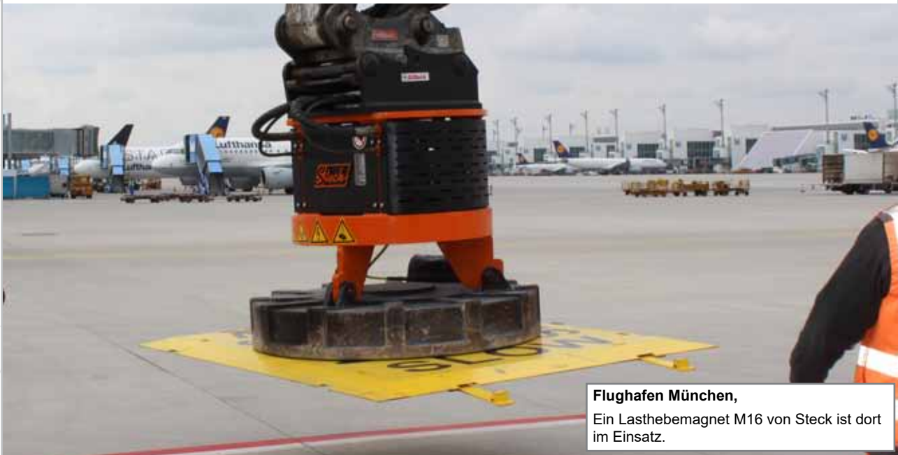
Flughafen München, Ein Lasthebemagnet M16 von Steck ist dort im Einsatz.