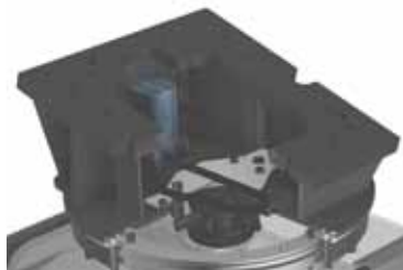
2x verstärkter Drehmotor mit integriertem Schockventil